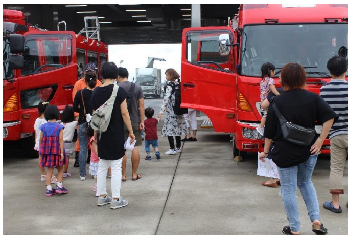
8、車両展示（消防車両）