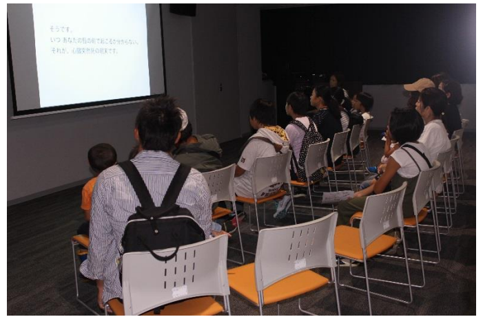
2、DVD 放映 (心肺蘇生法)