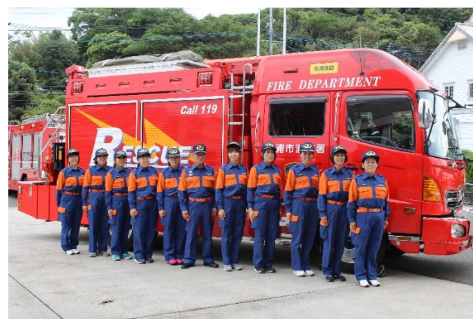
11、女性消防団集合写真