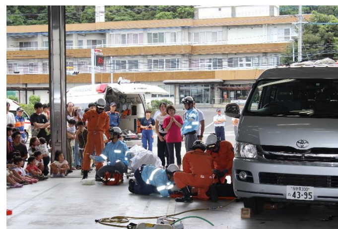
10、救急救助シミュレーション